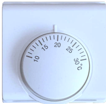
MODEL REFERENCYJNY: TR-10