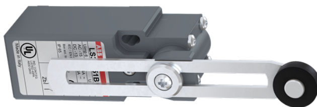
MODEL REFERENCYJNY: LS45M51B11